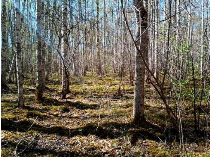
Lõiguke Vaibla nurmkanade rännuteelt.

“Käivad jah kahekesi, teised on kusagile ära kadunud. Aeg-ajalt soojendavad end meie lillepeenras!” Hoiame Hippele ja Lallile põialt, kuna vaid saatjatega paar saab anda meile aimu, kuidas üks nurmkanade pereelu õigupoolest käib.