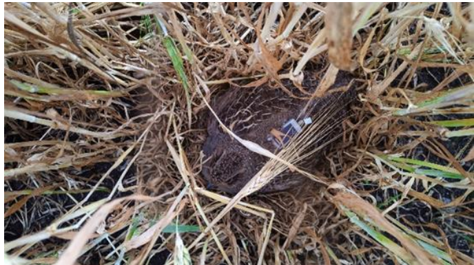
Küllu viljapõllu tehnorajal järelkurna haudumas (16.07.2021), Leie küla, Viljandimaa.

Eeldasime, et nurmkanad eelistavad pesitsemiseks pigem põldudevahelisi maastikuelemente nagu puuderibad, hekid, kraaviääred või kivikangrud. Küllu üks kurn hukkus paraku röövluse, teine suvise viljalõikuse tõttu.